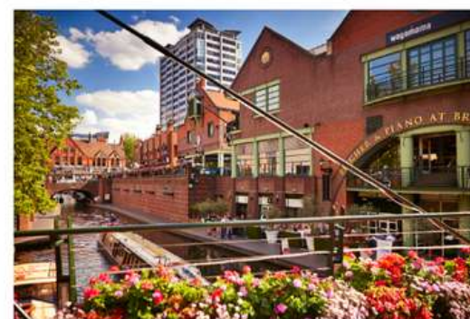
The canals in Birmingham are a lovely place to hang out

Fun fact: Did you know that you can go from the city centre to the campus for just £1? What a great deal with your student ID!